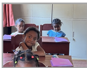
Elèves du relais