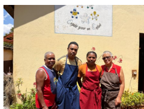
L'équipe de la cuisine