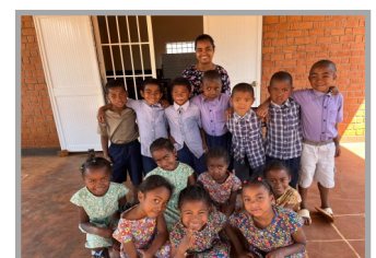
Tous les enfants du relais